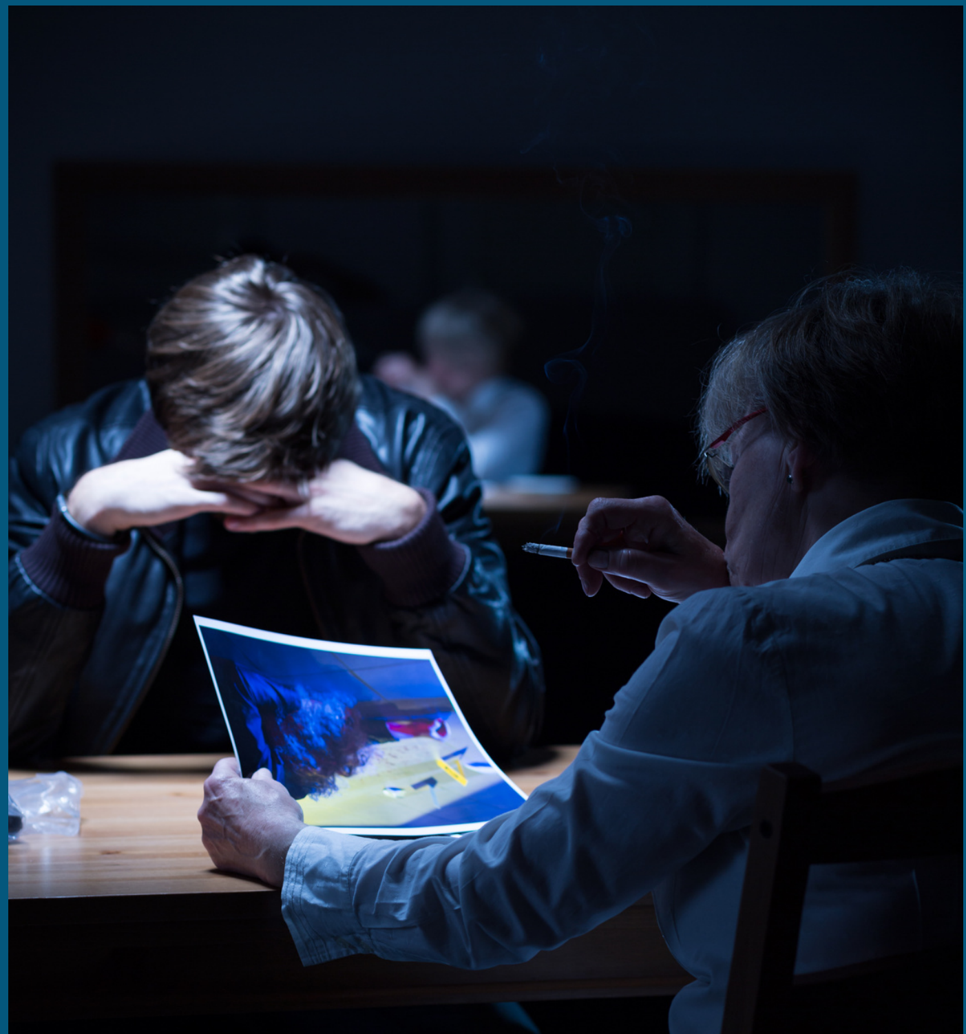
(មាត្រា១៤ នៃច្បាប់ស្តីពីយុត្តិធម៌អន្តិជន )