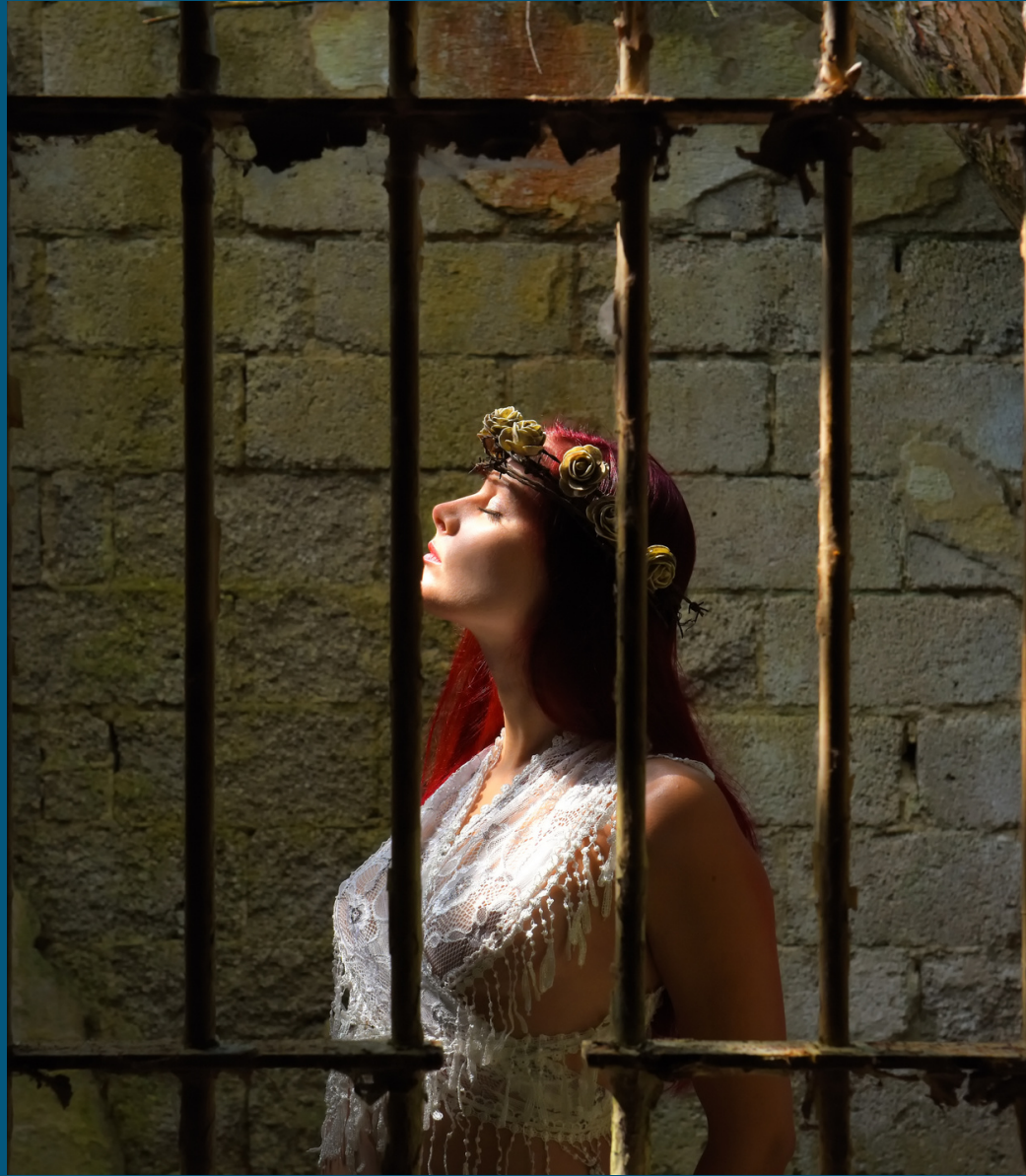
(មាត្រា ២១១ & ២១៤ នៃក្រមនីតិវិធីព្រហ្មទណ្ឌ)

រយៈពេលនៃការឃុំខ្លួនបណ្តោះអាសន្នក្នុងបទឧក្រិដ្ឋដែល ប្រព្រឹត្តដោយអនីតិជនចាប់ពី ១៤ ដល់ក្រោម ១៨ ឆ្នាំ