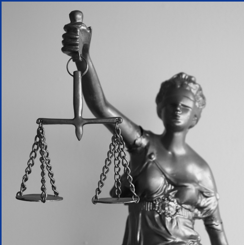
១. ដង្ហែងអំពើសិទ្ធិ