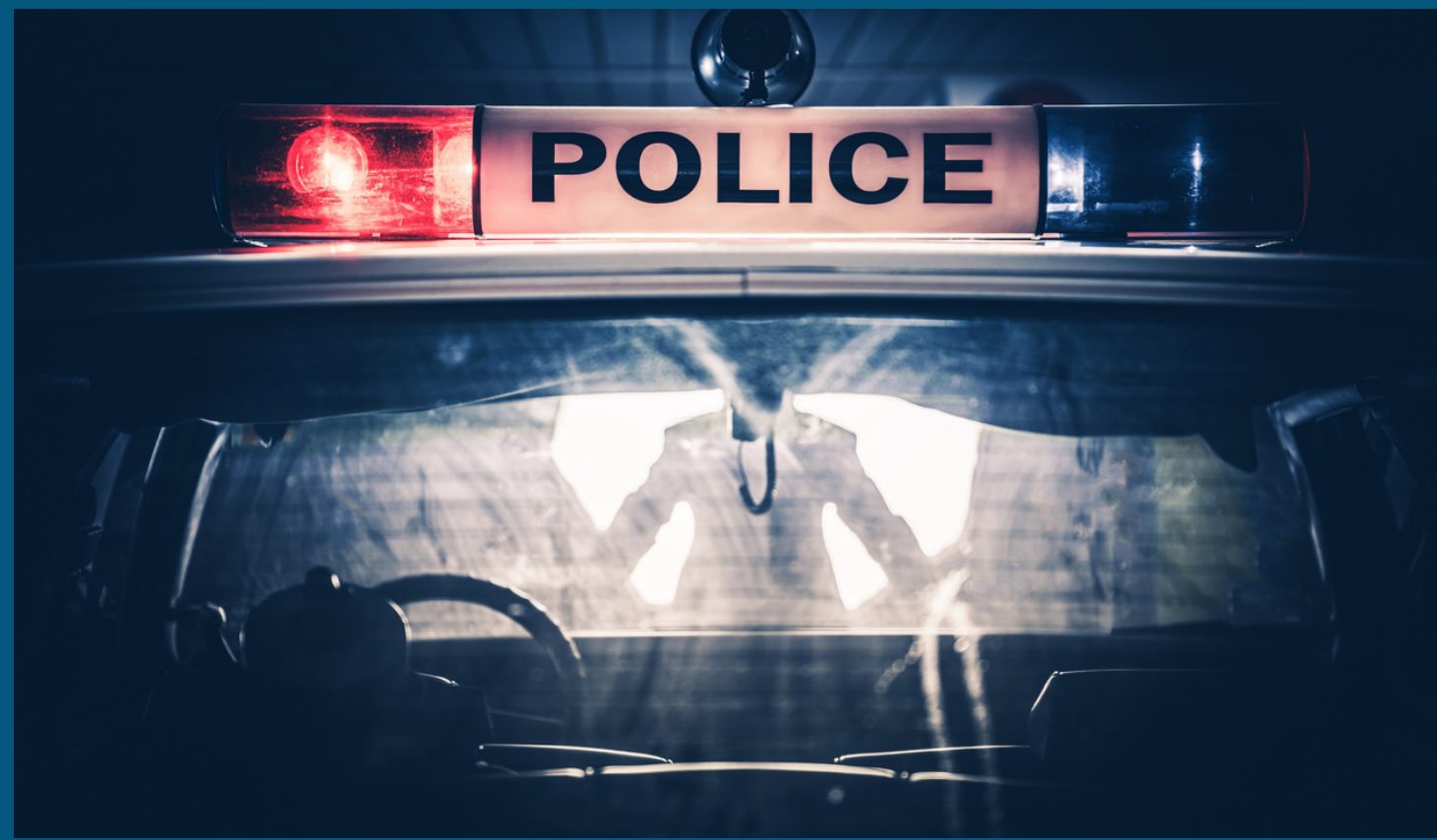
( មាត្រា ១៣ នៃច្បាប់ស្តីពីយុត្តិធម៌អនីតិជន )